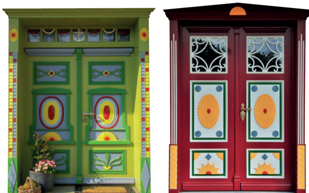
Beispiele für Darßer Haustüren

Bei dem seit der zweiten Hälfte des 18. Jahrhunderts immer gebräuchlicher werdenden neuen Haustyp erhielt die Haustür, in der an der Straße liegenden Traufseite, eine neue Bedeutung. Sie rückte in den Mittelpunkt der Fassade und eignete sich damit hervorragend zur Darstellung der gesellschaftlichen Stellung der Bewohner und wurde gleichsam zum Status-