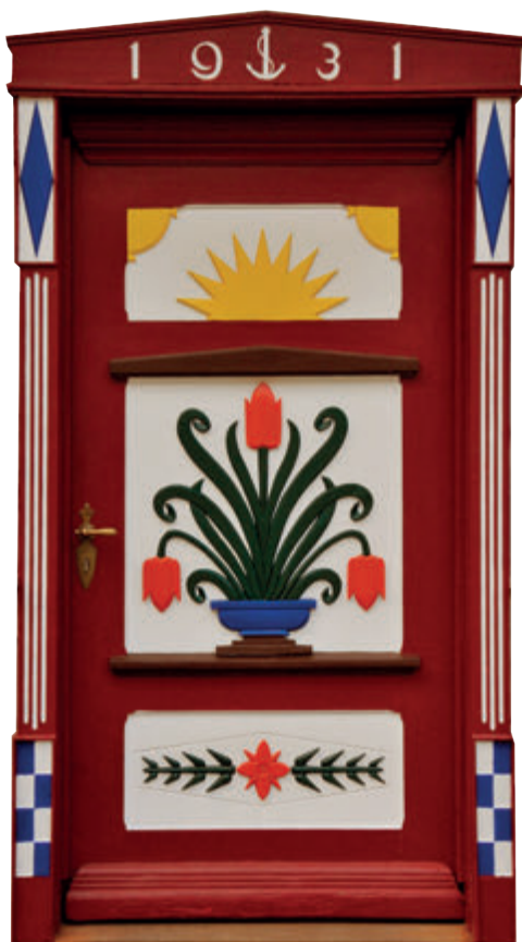
Darßer Haustür