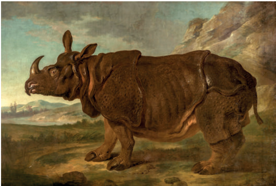
Jean-Baptiste Oudry „Rhinozeros“ 1749