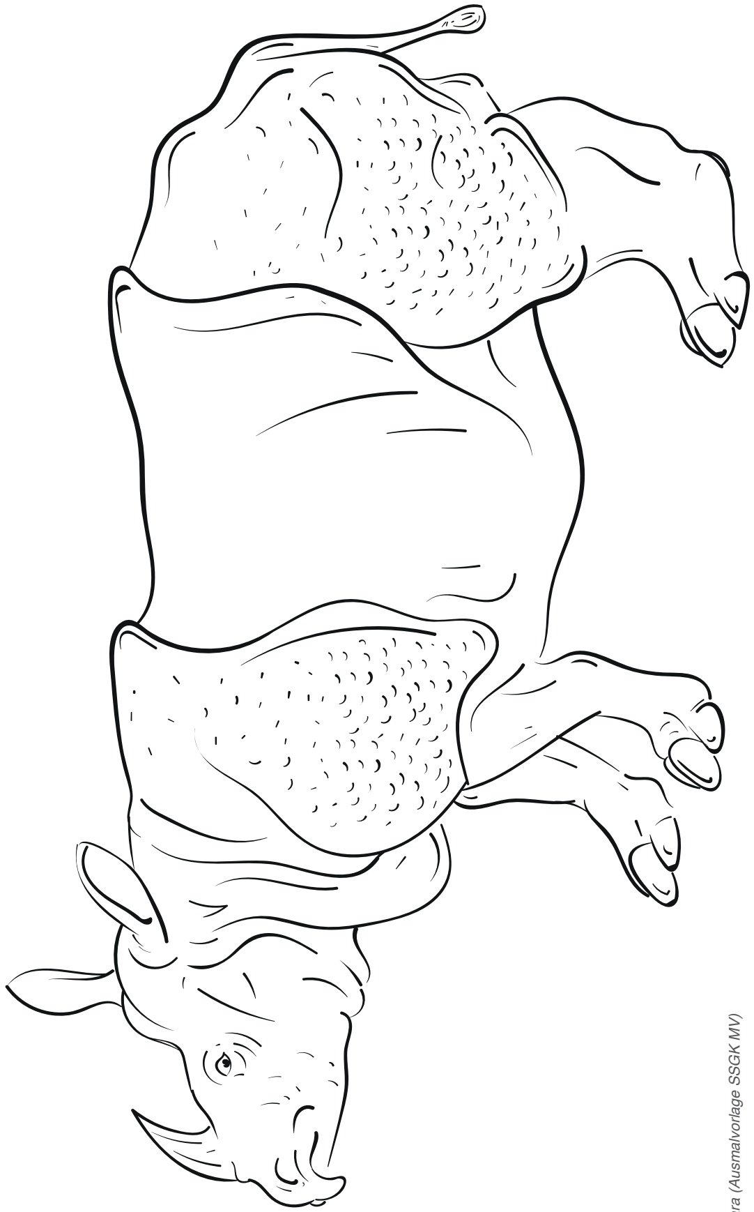
Nashorn Clara (Ausmalvorlage SSGK MV)