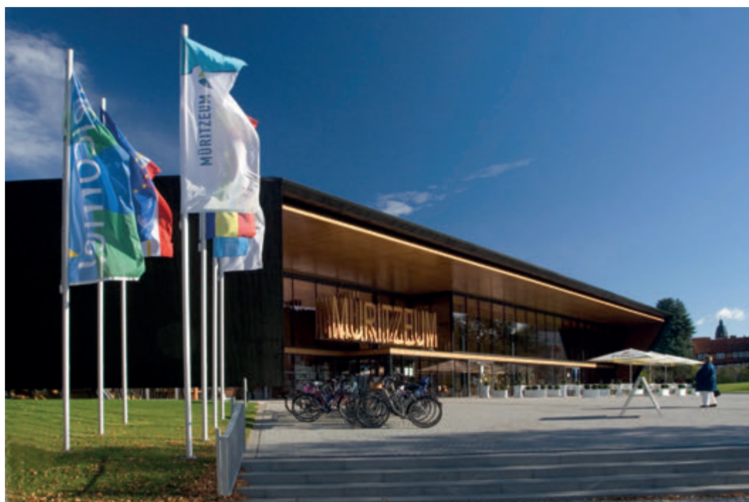
Das Müritzzeum

Das Müritzzeum ist ein interaktives NaturErlebnisZentrum und Museum über die heimische Flora und Fauna rund um die Mecklenburgische Seenplatte. Neben unserer Naturhistorischen Landessammlung von M-V, beherbergen wir eine Wald-, Vogel- und Zeitreiseausstellung sowie das größte Aquarium Deutschlands für heimische Süßwasserfische.