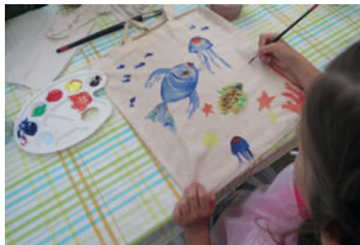
Kinder beim kreativen Schaffen