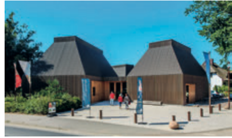
Kunstmuseum Ahrenshoop

Weg zum Hohen Ufer 36 18347 Ostseebad Ahrenshoop 038220/6676914 Ansprechpartnerin: Birgitt Sandke sandke@kunstmuseum-ahrenshoop.de www.kunstmuseum-ahrenshoop.de